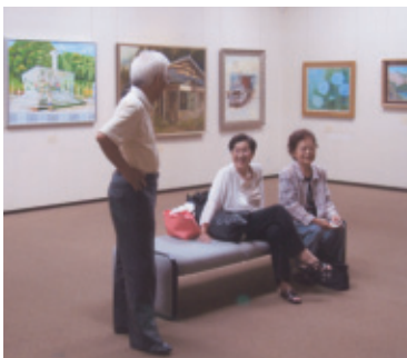
平成22年7月6日(火)〜11日(日) 会場…桜ヶ丘ミュージアム

今年で、五年目(五回展)の正風会、習作ばかりの作品展にもかかわらず大勢の皆様にご来場頂き、誠にありがとうございました。