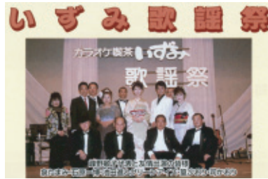
平成22年9月20日(祝) 会場…豊川市文化会館

カラオケ喫茶いずみ創立三十周年を祝っての第一回歌謡祭を開催致しました。生バンドとカラオケの一日、楽しい歌謡祭ができました。事を御礼申し上げます。豊川市文化会館