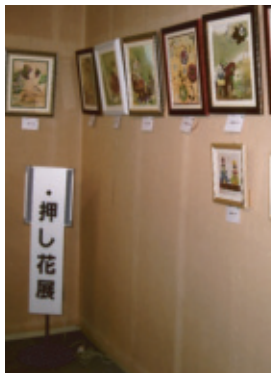
10月29日(金)～11月3日(祝) 会場…豊川市文化会館展示室