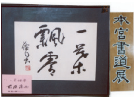
平成22年9月1日(火)〜15日(火) 会場…本宮の湯ギャラリー

本年の本宮の湯の作品展は会員十三名の心がこもった三十点を展示しました。日に三十余名のお客さんは、立ち止って見ていただいています。