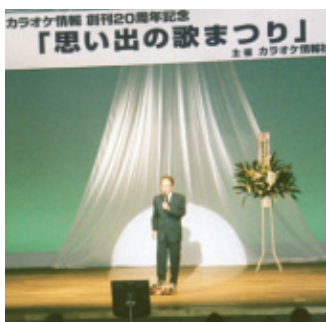
平成22年8月8日(日) 会場…豊川市文化会館

満員の会場でカラオケファンの皆さんと二十年間の思い出を語り、歌い合った発表会でした。『ともにいつまでも、健康で』そんな願いを込めた舞台でした。