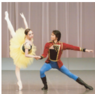
平成22年7月11日(日) 会場…幸田町民会館

今年、コンクール入賞者を含む二十五名が出演しました。来年度は六月十二日(日)にフロイデンホールで行います。(入場無料)