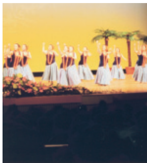
平成22年7月4日(日) 会場…新城文化会館

ハラウ フラ オ カプアノ ホマリー発表会。明るく元気に華やかに始めての方にも気軽にできるフラダンスを目標に全員で頑張りました。