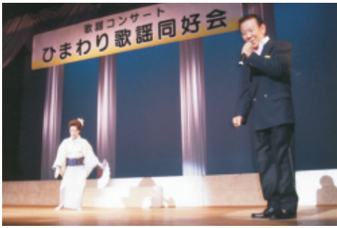
平成22年9月26日(日) 会場…豊川市文化会館

秋晴れの日、爽やかに、朗らかに、心こめて発表「歌謡コンサート」を盛り上げた。初々しさが感動を呼び「次は、いつ」の期待を抱かせ幕が降りた。大成功！