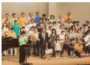
平成22年7月11日(日) 会場…豊川市文化会館

梅雨明け前の足元の悪い日でしたが大勢の方に演奏を聞いていただきました。団員一同、感謝です。これからも美しいハーモニーを目指し精進いたします。