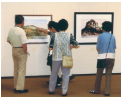
平成22年7月13日(火)〜18日(日) 会場…桜ヶ丘ミュージアム

本年も連日多くの方々のご来場を頂き、第十五回一宮アートを開催する事が出来ました。次回も会員一同、日々努力し、感動していただける作品作りを挑みます。