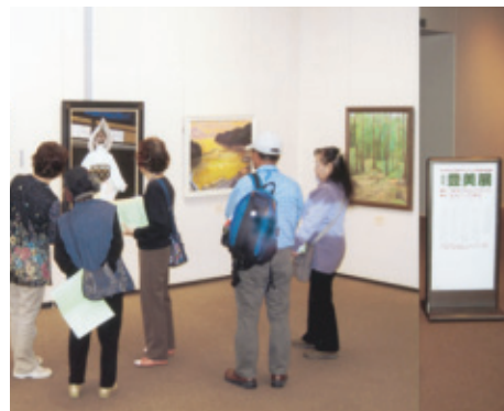
10月12日(火)～17日(日) 会場…桜ヶ丘ミュージアム展示室