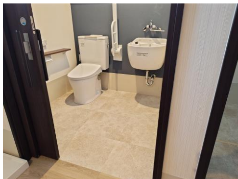
【バリアフリートイレ】