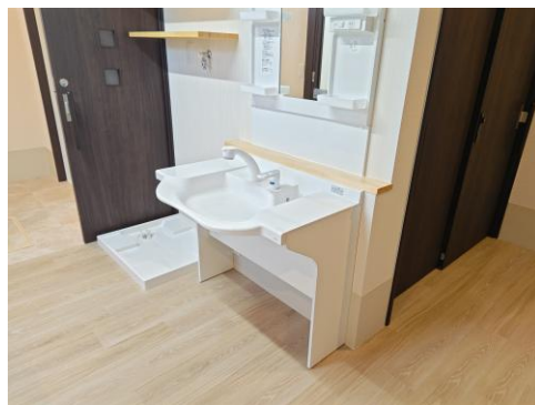
【車イスで使用できる洗面台】